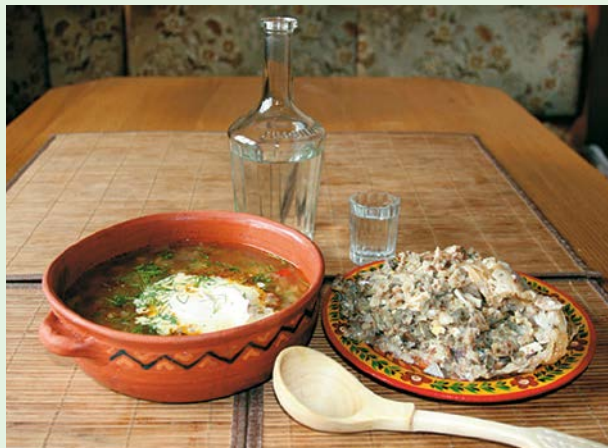
Šči in kaša, kralja ruske kuhinje.

Zanimivo in uporabno: besedo za krompir je ruščina prevzela neposredno iz nemščine in je moškega spola: картофель (kartofel'), pogovorno pa se uporablja beseda ženskega spola – картошка (kartoška).