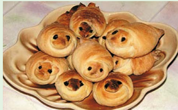
Sladki škrjančki

Zanimivo in uporabno: v večjem delu Rusije po ljudskem izročilu prinašajo pomlad škrjanci = жаворонки , v Sloveniji pa lastovice ( ласточки lastočki), štokrlje ( аисты aisty) in kukavice ( кукушки kukuški).